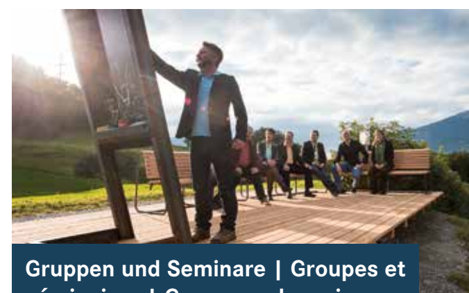
Gruppen und Seminare | Groupes et séminaires | Groups and seminars

www.glarussell.ch/shop www.glarnerland.ch/glarner-produkte