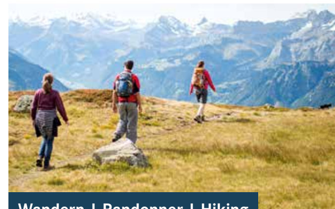
Wandern | Randonner | Hiking

DE In 19 Etappen das Glarnerland umwandern, das ermöglicht die Via Glaralpina. Daneben gibt es etliche Bergseen, Höhenwege oder andere Highlights zu entdecken. Wer höher hinaus will, nimmt sich eine SAC Hütte vor oder lässt sich von Bergführern oder Wanderleiterinnen führen.