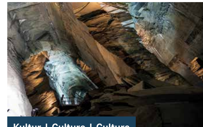
Kultur | Culture | Culture

DE In Elm und im Landesplattenberg Engi (11) wird vom Schiefer erzählt, in Ennenda von der «letzten Hexe» Anna Göldi (7). Der Freulerpalast (5) punktet mit der Landesausstellung. In Glarus gibt es Stadtführungen, das Landsgemeinde-Pop-up-Museum, das Kunsthaus und das Stadt-Open-Air Sound of Glarus. Für Live-Musik sorgt auch das BSINTI in Braunwald oder die Kulturbühne Lihn (4) in Filzbach.