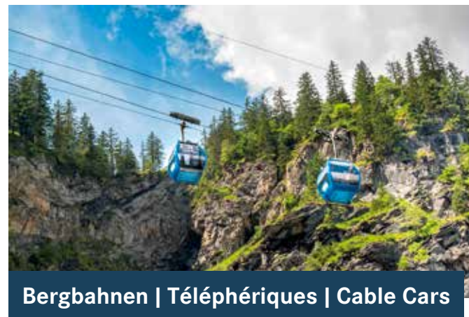
Bergbahnen | Téléphériques | Cable Cars

DE Die Sportbahnen Elm und Braunwald führen Gäste direkt ins Wandergebiet – ebenso wie die Luftseilbahn Niederurnen – Morgenholz (2), die Kerenzerberg- (4) und die Aeugstenbahn (8). Mehr Höhenmeter-Service gibt es in die Weissenberge (10), auf Mettmern, die Tschinglenalp (13), Richtung Oberblegisee (14), Limmern (16) oder vom Urnerboden auf den Fisetengrat.