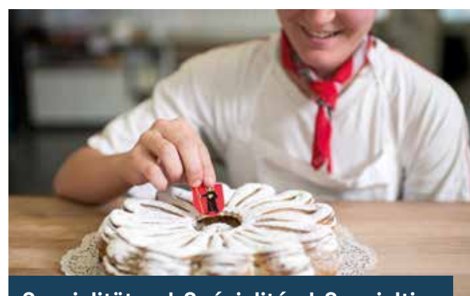
Spezialitäten | Spécialités | Specialties

DE Am besten ist ein Adler Bräu Bier in einer Glarner Bar, genauso wie der Ziger über den Höreli in der hiesigen Beiz am würzigsten schmeckt. Trotzdem nimmt auch manch ein Glarner Beggeli eine Reise auf sich, möglich machts der Glarner Webshop Glarusell. Elmer Citro ist schliesslich auch schweizweit ein Genuss, Läderach Schoggi (1) gar weltweit.