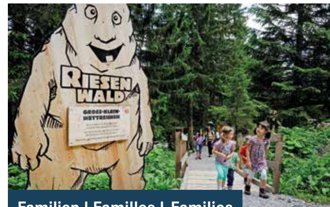
Familien | Familles | Families

DE Braunwald ist mit dem Märchenhotel, dem Zwerg-Bartli-Erlebnisweg und dem Kinderklettersteig der Familienort Nr. 1 im Glarnerland. In Elm entdecken Familien den Elmer Citro Quellenweg oder den Riesenwald beim Kinderparadies Ämpächli (12). Auf dem Kerenzerberg erwartet einen der Drachenspielfeld. Alle drei Ausflugsziele bieten schnelle Abfahrten mit dem Trotti.