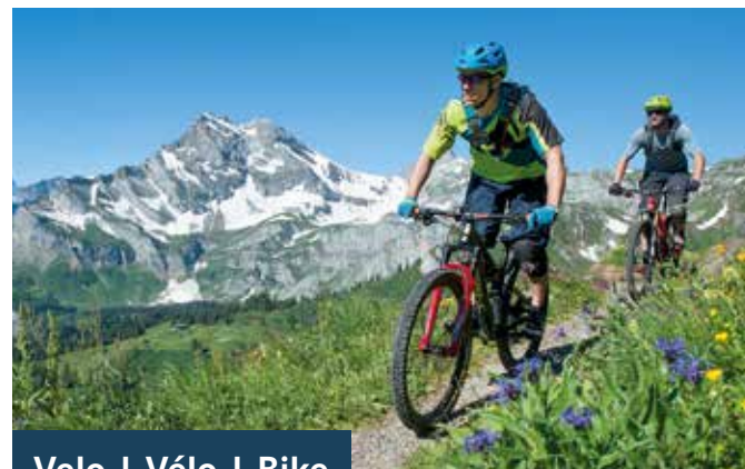
Velo | Vélo | Bike

DE Willkommen im Bike-Valley: Mit Rennvelos geht es über den Prugel- oder den Klausenpass, mit E-Bikes macht man die Panoramatur in Braunwald oder peilt die Bischofalp in Elm an. Auf einem Mountainbike empfiehlt sich der Flowtrail (19) von der Schwammhöhe runter nach Glarus.